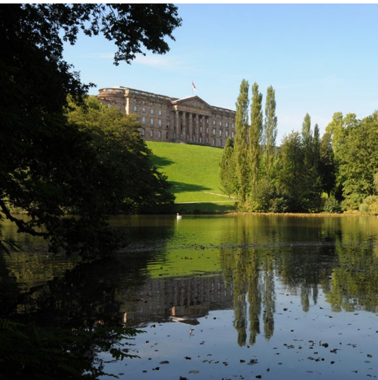
Bergpark mit Schloss