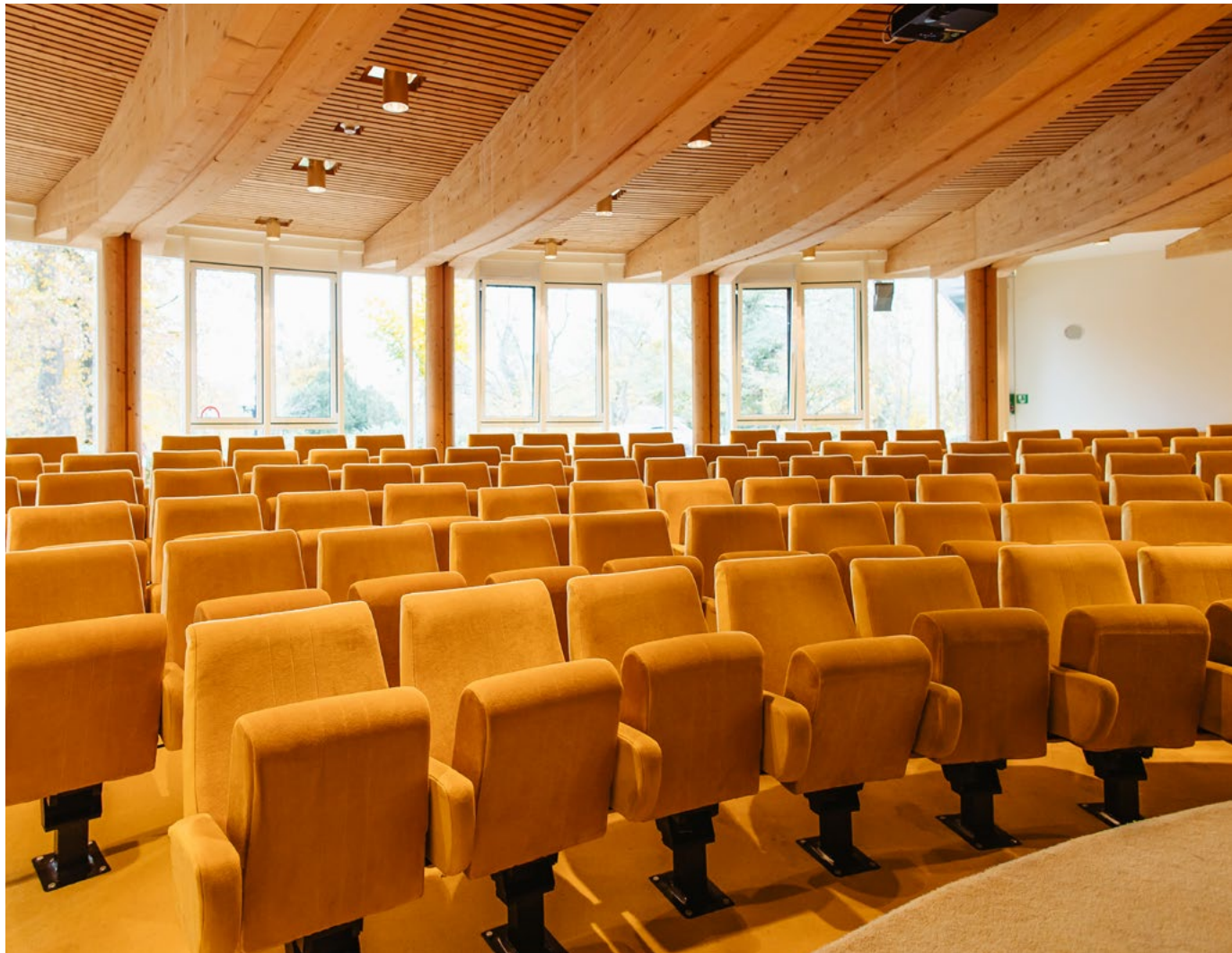
Vortragssaal (mit Parkblick)